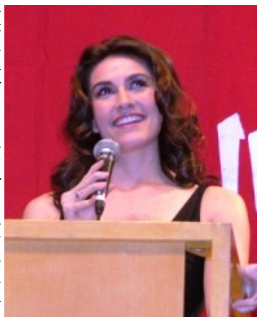
Nazanin Afshin-Jam, Miss Canada 2003, och människorättsaktivist

Nazanin frigavs till slut den 30 januari från fängelset i Teheran. Hon återsåg friheten efter en omänsklig döds kamp i 3 års tid. Att i 3 ständiga år, närmare 1000 dagar, räkna sekunderna marschen mot den avskryvda lyftkranen, dödens kran, måste räknas som brott mänskligheten, inte minst med tanke på att detta ofattbara brott har begått mot ett barn, en 17 årig flicka, som inte bara har förlorat tre år av sina